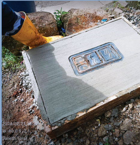
2024/02/21 16:30 W -80.0 S / 78.1 Janeth Toral

Se ha construido el sistema integral de agua potable que abarca desde la instalación de 12.14 Km. de tuberías hasta un sistema de bombeo proyectado para abastecer a los usuarios que residen en las áreas más altas de esta comunidad. Estas mejoras representan un compromiso significativo con el bienestar y el progreso del sector.